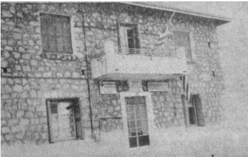
Εικών 8. ΔΙΟΙΚΗΤΗΡΙΟΝ ΦΙΛΙΩΝ. Ἐαναγερθὲν δαπάναις τοῦ συμπολίτου Θεοδ. Γεωργάκου.