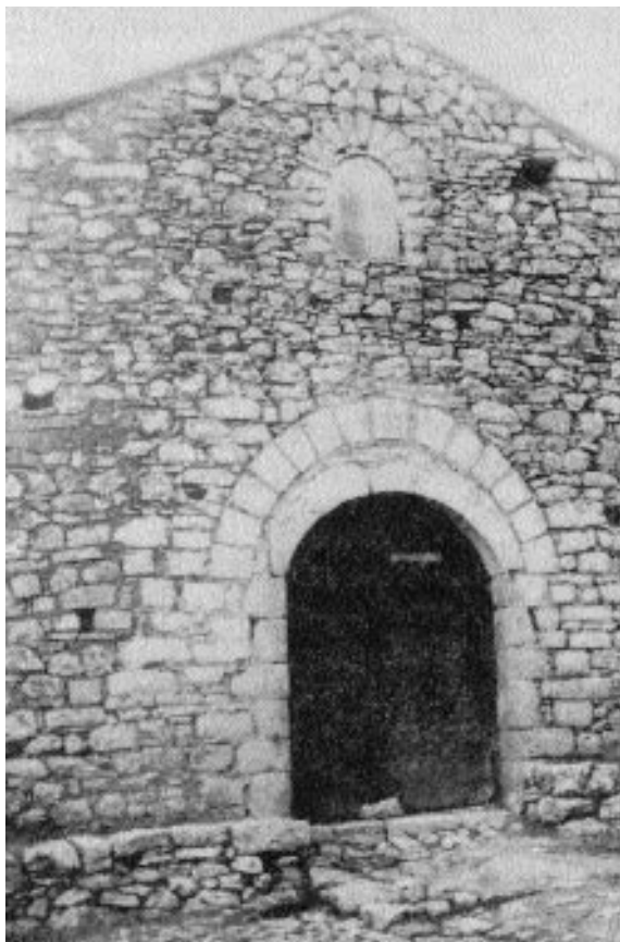
Εἰκὼν 11. Ἱερὰ Μονὴ Ἁγ. Ἀθανασίου. Ὁ πυλὼν τῆς μονῆς.

ρειχομένη εις τὴν διαθήκην τῆς μοναχῆς Γρηγορίας ὁμοιάζει φραστικῶς πρὸς τὴν τοῦ Γρηγορίου τοῦ Ναυζιανζηνοῦ. 1