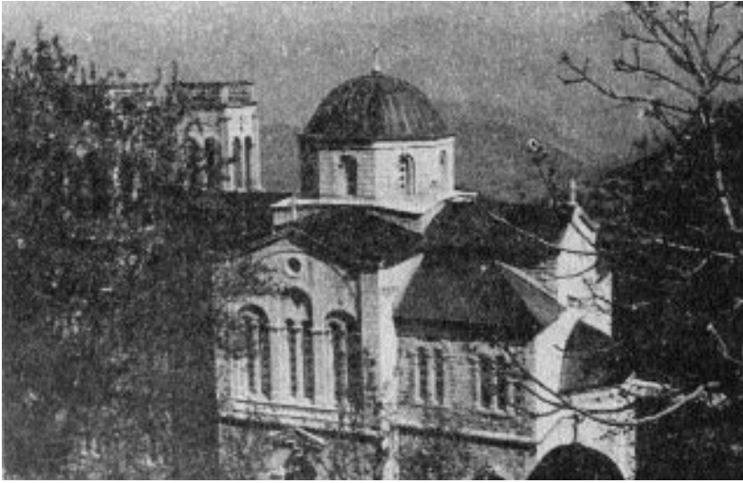
Εἰκὼν 9. Ὁ Ἱ. Ναὸς Φιλίων Ἡ ΚΟΙΜΗΣΙΣ ΤΗΣ ΘΕΟΤΟΚΟΥ.

ἡ κλιμαξ εἰσόδου κατεσκευάσθησαν ἐκ λευκοῦ μαρμάρου. Καὶ ἤδη ἐγείρεται μεγαλοπρεπῆς καὶ ἐπιβλητικὸς, ὡς οἱ καθεδρικοὶ ναοὶ τοῦ μεσαίωonos, μνημεῖον αἰώνιον τοῦ φλογεροῦ ἐnthουσιασμοῦ καὶ τῆς βαθείας θρησκευτικῆς πίστεως ἡ ὁποία ἐν προκειμένῳ δὲν μετεκίνησεν ἀπλῶς ὄρος, ἀλλ' ἐδημιούργησεν ὄρος, διότι ὡς ὄρος φαίνεται ἀπο μακρὰν, ἀλλὰ καὶ ἀπὸ πλησίον, ὁ ναὸς διὰ τοῦ ἐπιβλητικοῦ ὄγκου του καὶ τῆς μεγαλοπρεπείας του. Οἱ Φιλαῖοι δικαίως σεμνύνονται διὰ τὸν ναὸν των, ὡς θὰ ἐσεμνύνοντο καὶ οἱ κάτοικοι οἰουδήποτε ἄλλου μεγάλου ἢ μικροῦ οἰκισμοῦ τῆς χώρας. Ὁ ναὸς τιμᾶται ἐπ' ὀνόματι τῆς Κοιμήσεως τῆς Θεοτόκου. 1