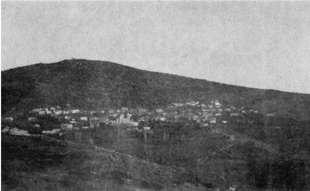
ΕΙΚΩΝ 1. ΜΕΡΙΚΗ ΑΠΟΥΣΙΑ ΦΙΛΙΩΝ.